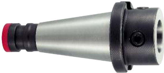
Grundaufnahme mit MVS Master shank with MVS Module de base avec MVS