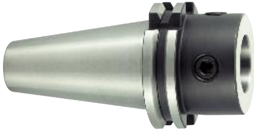
Grundaufnahme mit MVS Master shank with MVS Module de base avec MVS