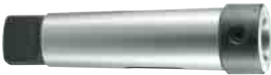
DIN 228 A / 2207